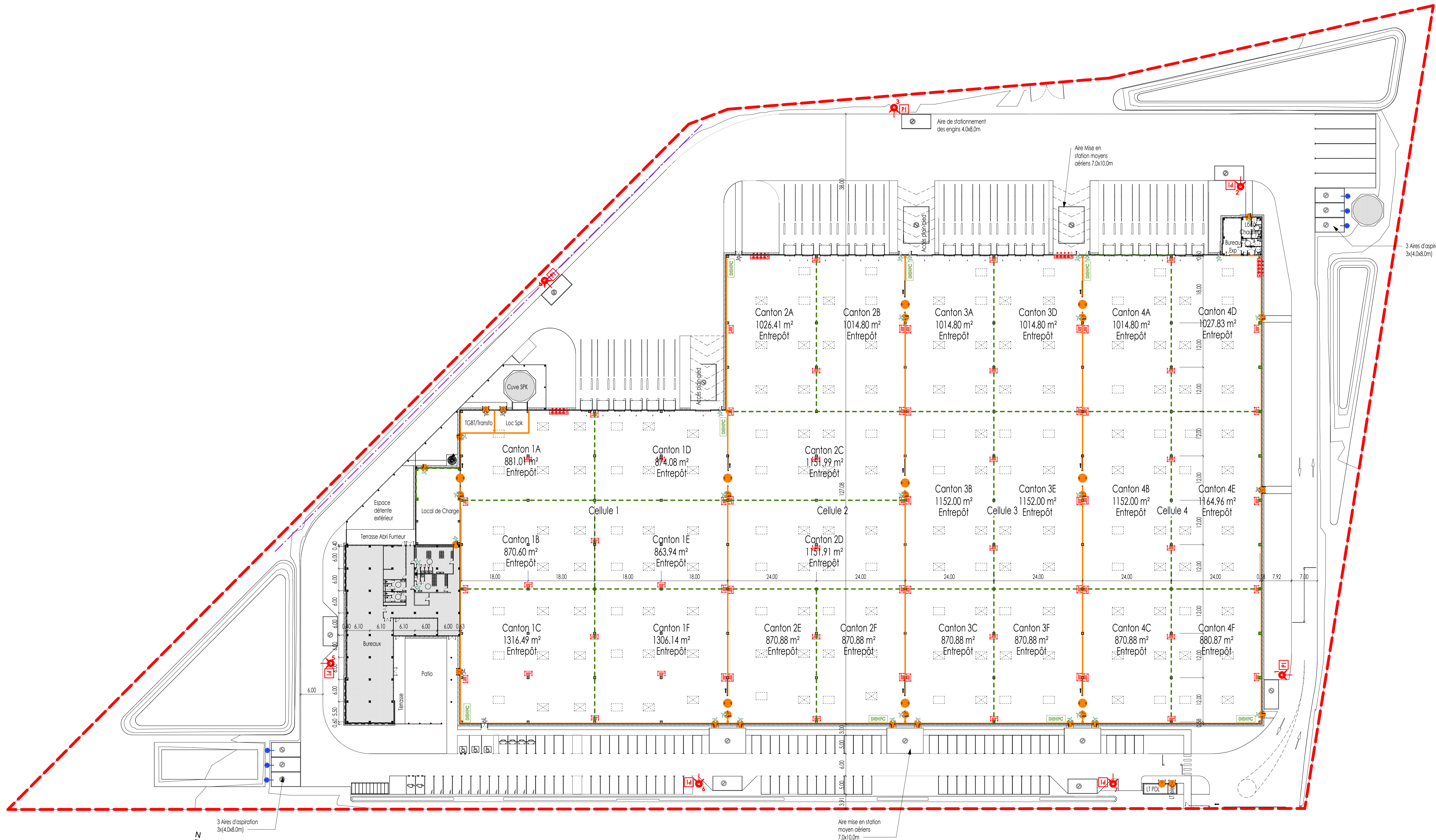
Plan RDC de sécurité incendie